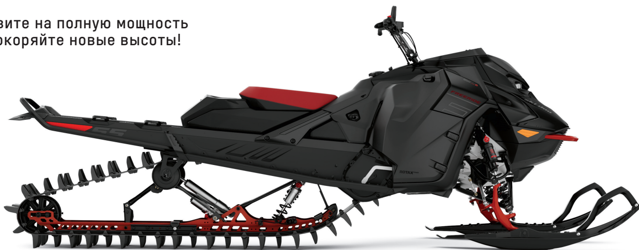
МОДЕЛЬ FREERIDE 165 850 E-TEC TURBO R

Живите на полную мощность и покоряйте новые высоты!